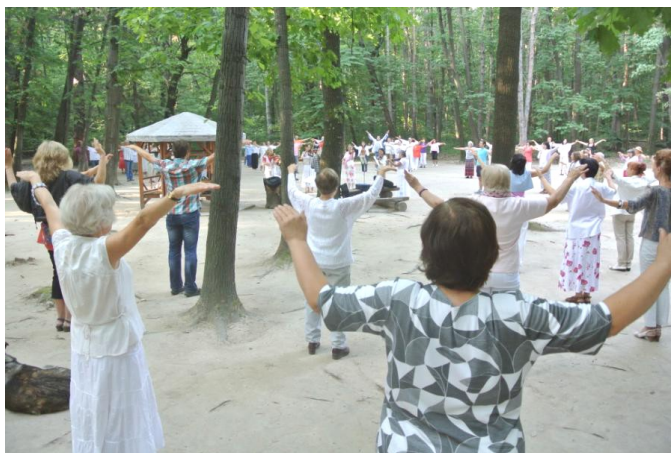
Paneurytmium v Sofii

A tak jsme s bratrem po 23 letech a má žena poprvé cvičili paneurytmium. Samozřejmě jsme hlavně dávali pozor na cviky („opisovali“ jsme, co dělali ostatní), takže ta duchovní stránka byla vnímána jen zlehka. Ale již samotné propojení hudby a cvičení bylo příjemné a po hodině jsme se cítili velmi dobře.