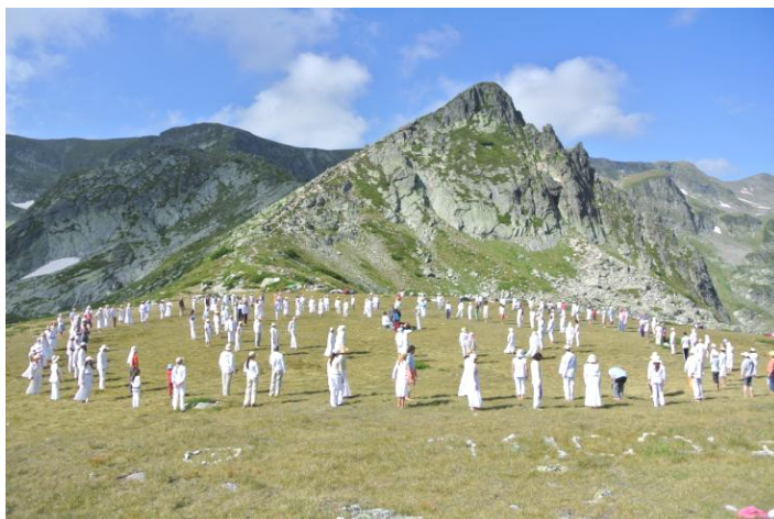
Paneurytmium u jezera „Čistoty“ pod Charamiatou

tějších činností žáka. Učitel říkával: kdyby se člověk uměl správně modlit, splnilo by se mu vše. A já si dovoluji doplnit: čím je stupeň vývoje člověka vyšší, tím je jeho modlitba hlubší, uvědomění vyšší a tím i přání jsou ušlechtilější a splnitelnější, bez negativních následků. A modlitby mají i různý charakter. Individuální, tichá modlitba z hloubi duše, prosba o pomoc, ochranu, o ukázání správného směru, správného rozhodnutí. Modlitby společné, které mají úžasnou sílu pro společnost, celé lidstvo. Musí být ale správně formulovány, aby nemohly být zneužity. Modlitby za někoho, pro někoho, ať už „bydlí“ v těle, nebo je už mimo něj. To vše hraje v životě žáka důležitou roli.