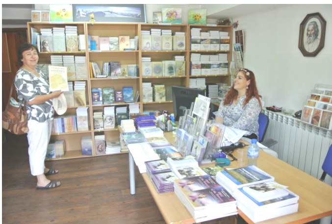
Obchod s knihami Bílého Bratrstva v Sofii

Mimochodem, z našeho pobytu v r. 1967 jsme si přinesli zkušenost, že mnoho bratrů a sester se do hloubky zajímalo o nejrůznější směry: fyziognomii, chiromantii, astrologii i astronomii, grafologii atd. I předpověď z hrnečku kávy jsme tehdy dostali, která se – jen tak mimochodem – do puntíku splnila. Závěr dne patřil návštěvě minimuzea Učitele s výkladem průvodce, který se z počátku méně ochotně, později velmi zaujatě, rozsáhle a podrobně rozhovořil v místech, kde Učitel pobýval poslední měsíce před svým odchodem z těla – po rozloučení s nejbližšími žáky a těsně před tím, než jej přišli zatknout nacisté v prosinci r. 1944.