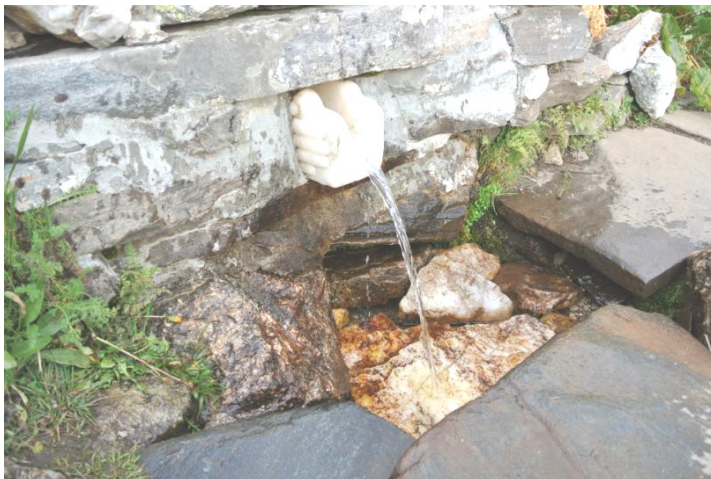
Pramen Učitele „Ruce, které dávají“

Tichá jízda mezi korunami stromů je velmi příjemná a pokud využijete pomoc řidičů džípů a horských koníků, je výstup k našemu cíli – Sedmi rilským jezerům – velmi pohodlný. Naše putování se přiblížilo k symbolickému i opravdovému vrcholu. Konečně, po hodině cesty od lanovky, jsme jen s malými batohy došli do tábora nad druhým jezerem, které Učitel nazval „Elbur“, což znamená Bůh je silný. Po mnoha letech jsme opět mohli obdivovat nádhernou scenérii horských štítů a údolí Sedmi rilských jezer. Již od dvacátých let minulého století chodil Učitel se svými žáky do těchto míst a žáci se dále scházejí v čím dále větším počtu. Teď už je pobyt v horách bulharskou vládou časově omezen na srpen až počátek září vzhledem k tomu, že tato krásná oblast byla vyhlášena jako Národní park. Kdo četl pozorně knihu „Rozhovory u Sedmi rilských jezer“, má alespoň přibližnou představu o duchovní činnosti, která se zde odehrávala. Již v prvních letech Učitel našel vzácný pramen křišťálově čisté vody, kterému po úpravě zřídla do tvaru rukou všichni říkají v překladu „Ruce, které dávají“ – nebo zkráceně „Ručičky“. Všichni z tábora chodí k tomuto prameni, obsahujícímu nejen známé H 2 O, ale mnohem více hmotného i nehmotného obsahu. A když k tomu připojíte správnou myšlenku, stává se voda léčivou, posilující, regenerující, posvátnou... I my jsme si po