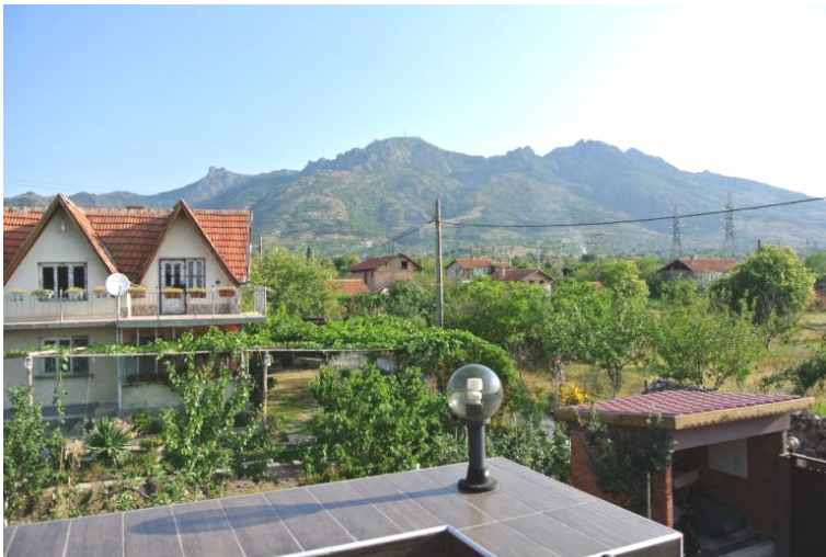
Pohled na Siné kameny ze Slivenu

Foto na titulní straně: Jaroslav Grossmann – Páté jezero „Srdce“