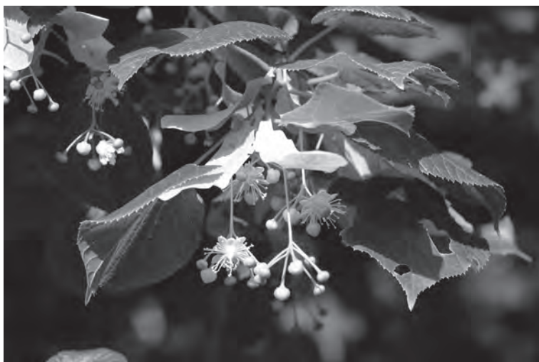
Lípa v květu.

čeři, a i když byl jejich domek jen velmi prostý a měli jen jedinou husu, neváhali hosta na prahu přijmout i s jeho doprovodem. Hned se chystali připravit hostům to nejlepší, co měli, totiž tu husu. Vtom ale Zeus zasáhl. Byl dojat jejich vlídností a opravdovou zbožností, a o to více, že mezi ostatními obyvateli v kraji nenalezl nic než krutost a zvyk zahrnovat bohy výčitkami a opovržením. Aby zpupné chování potrestal, rozhodl se seslat na zemi ničivou potopu, avšak staříčké dobré manžele Filemona a Baukidu před ní zachránil a nevidaným způsobem je odměnil. Vyslyšel jejich přání a modlitbu, aby zemřeli současně. Když je pak po mnoha letech přemohla smrt, proměnili se ve dva stromy, dub a lípu, které tam pak bok po boku rostly.