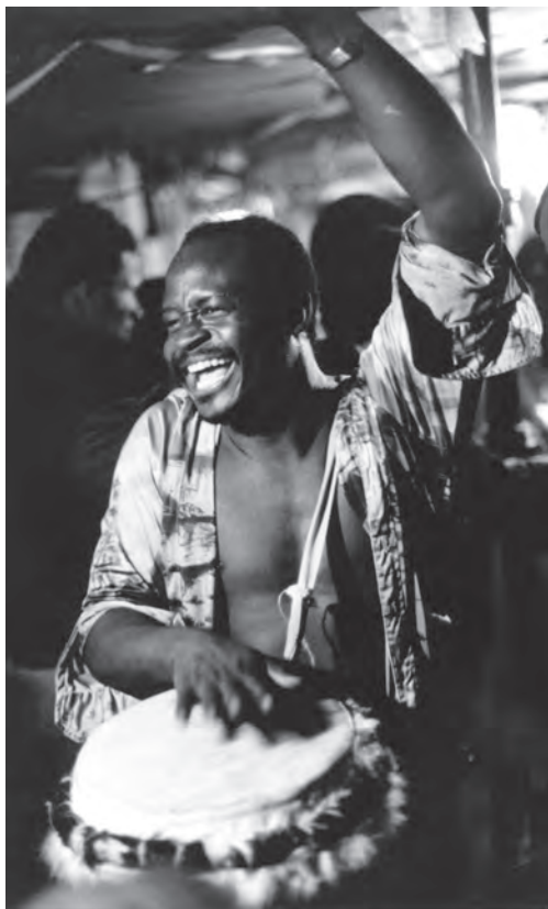
Bubnování k tanci voodoo na haiti, foto z 80. let 20. století.

Profesor i studentka mlčeli, seděli vedle sebe jako sfingy. Doktor Kelly se pohnul jako první. Plaše se úkosem na dívku podíval. Seděla vedle něho bohyně lásky haitských divochů, bohyně Erszulie. Rozjel se opatrně, protože cítil, že jeho myšlenky nejsou schopny soustředit se na řízení automobilu. Maryinu poslední stať znal už nazpaměť, hlavně pasáž, ve které líčí vlastní zážitky při rituálním tanci voodoo.