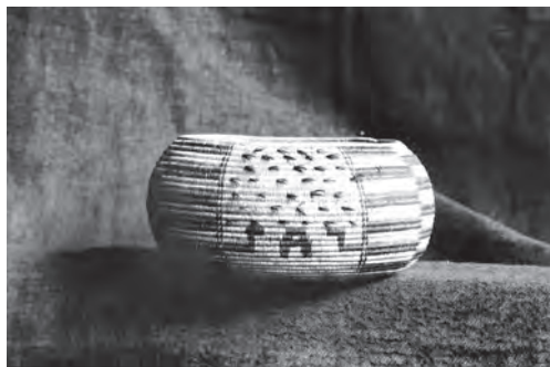
Indiánský koš s motivem hadů.

Hudba a sbor spustily řízný spirituál. Nástrojové obsazení kapely bylo velmi originální: dvě kytary, dvě harmoniky, basa a dva různě laděné bubny. Doktor se snažil udržet si nad děním v sále nezúčastněný nadhled, ale nedařilo se