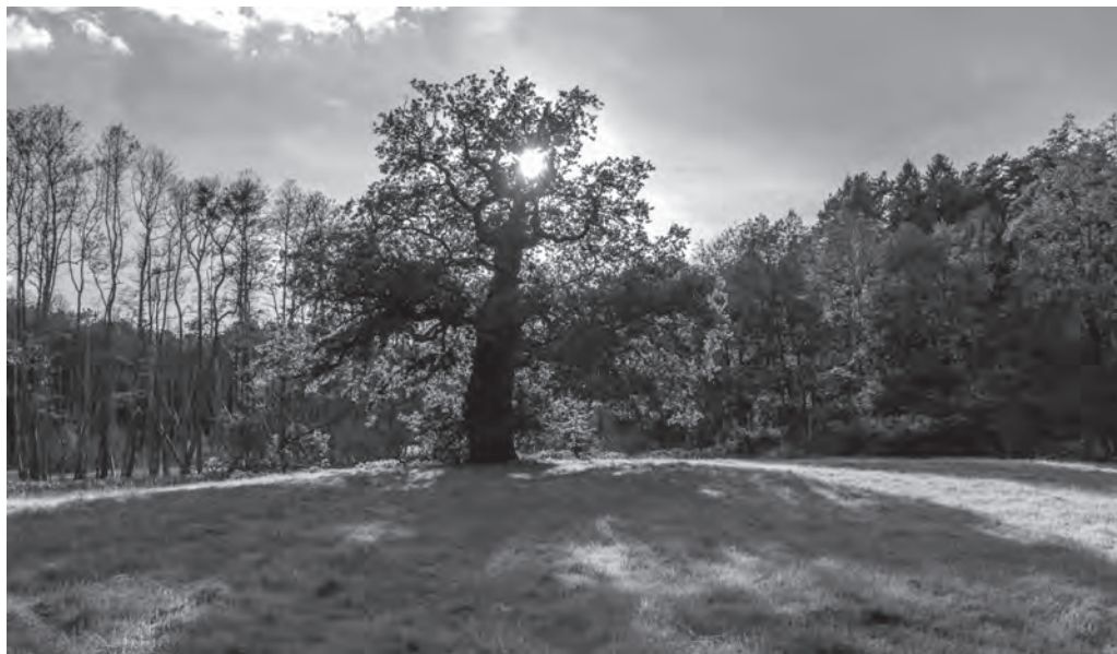
Starobylý dub.

Ve starých řeckých bájích je pověst o tom, jak nejvyšší bůh Zeus vyrazil do světa, aby se podíval, jací jsou lidé. Všude, kam přišel, se ale setkával jen s odmítnutím a hrubostí. Nikdo vůči němu nebyl pohostinný. Přestože procházel bohatým krajem, ve kterém neměli lidé nouzi, všude jej odbývali, ať táhne pryč. Až došel k nejchudšímu domu, ve kterém žili Filemon a Baukis, dobří skromní manželé, kteří se velmi milovali. Také zde požádal o nocleh a ve-