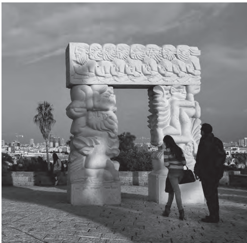
Brána víry, historické sídlo Jaffa, Izrael.