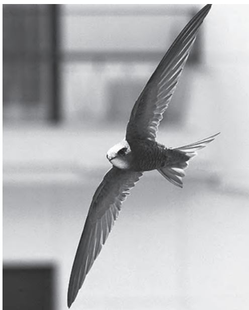
Letící rorýs.

rychle získal rychlost – to vše s nepatrným energetickým výdajem. Trajektorie (dráha) letu rorýsa v zatáčkách mi poměrně přesně připomíná lemniskátu, tedy křivku, podle níž se dělají oblouky železničních tratí pro výhodný hladký průjezd vlaku (jako by znal fyziku). Prostě let rorýse je elegantní a jeho vytrvalost překvapivá.