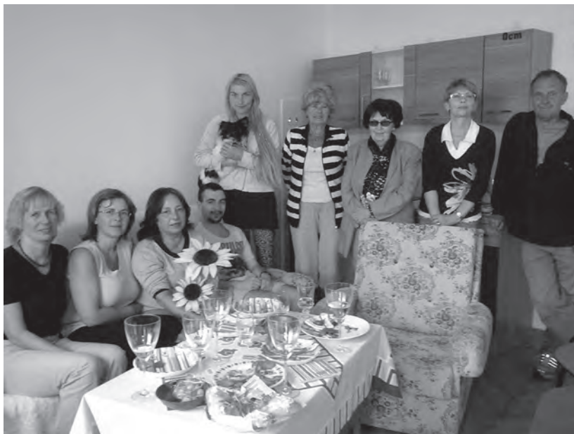
Ustavující schůze Liberecké obce unitářů, 16. června 2015.

terní přednášející, jednak i ta místa. Scházeli jsme se například U Friče, nebo v muzeu. Nakonec jsme natrvalo zakotvili v knihovně, protože je to dobré a strategické místo. Je v centru města a bylo možné tam uveřejňovat na světelné tabuli informace o našem programu. Teď máme své programy inzerované i na webových stránkách knihovny, což je pro nás určitá reklama a lidé z řad veřejnosti si za ta léta zvykli do knihovny na unitářské programy chodit.