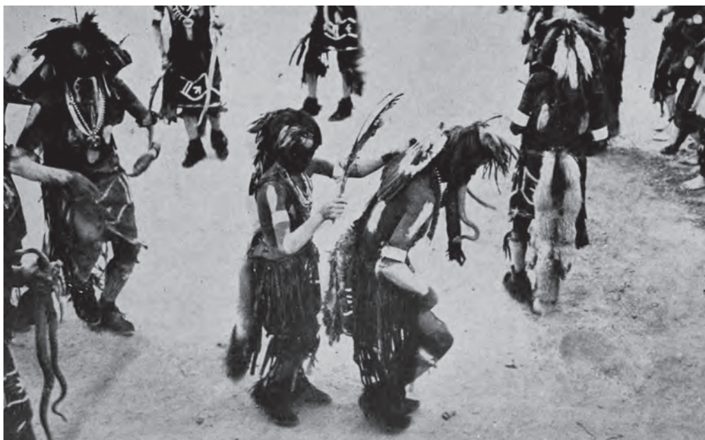
Rituální chřestýší tanec šamanů indiánského kmene Hopi, při němž si šaman hada přikládá k ústům, foto okolo roku 1900.

na něž se přelila vlna vzrušení a chvění. Asi čtyři stopy dlouhý had zaujal útočnou pozici. Doktor cítil, jak mu po celém těle stéká studený pot. Takový kapitální kus chřestýše ještě nikdy neviděl.