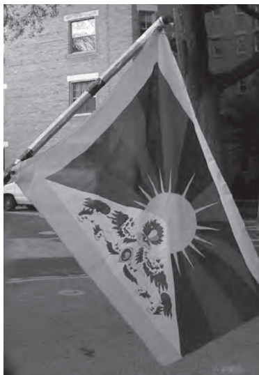
Tibetská vlajka.

Různí řečníci tlumočili rozhořčení nad současným kurzem naší zahraniční politiky, odklánějící se od důrazu na lidská práva a demokra-