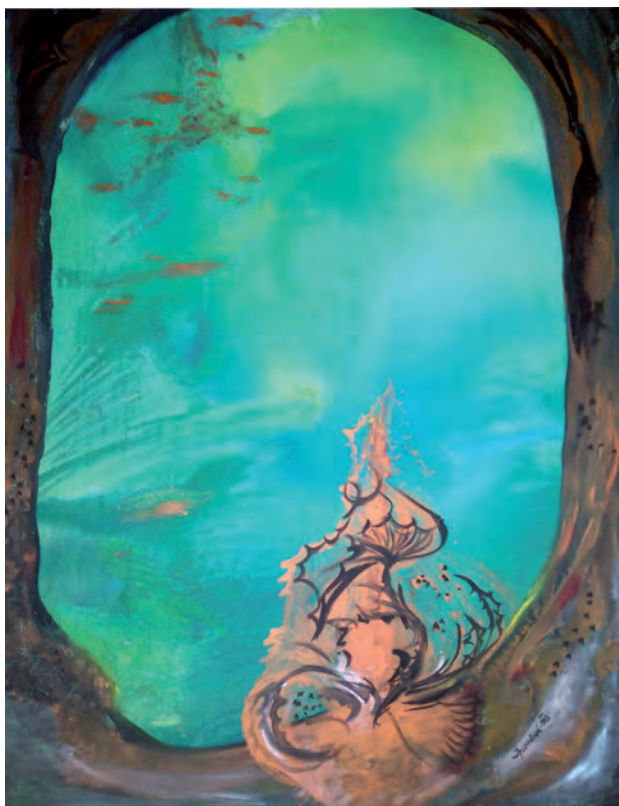
Prakticky žitá naděje dává člověku perspektivu. (Smaragdová naděje, obraz Jarmily Plotěné.)