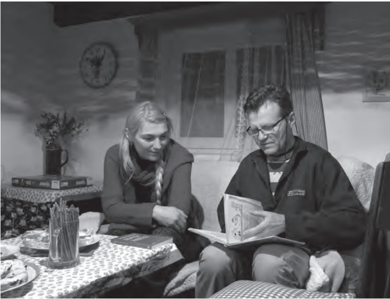
První literární večer Liberecké obce unitářů, Dlouhý Most, listopad 2015.

jít i na jiné programy a najednou máme vážného zájemce o členství, který to zase může říct dál.