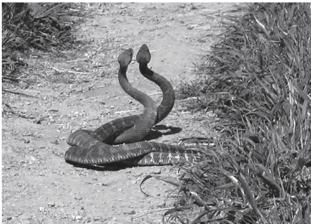
„Tanec“ chřestýšů.