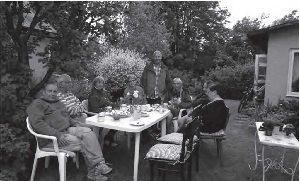
Květinová slavnost Liberecké obce unitářů, červen 2015.

Už tehdy jste přemýšleli, že byste se vytvořili samostatnou obec?