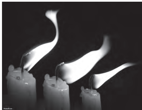
Víra kontra jistota.