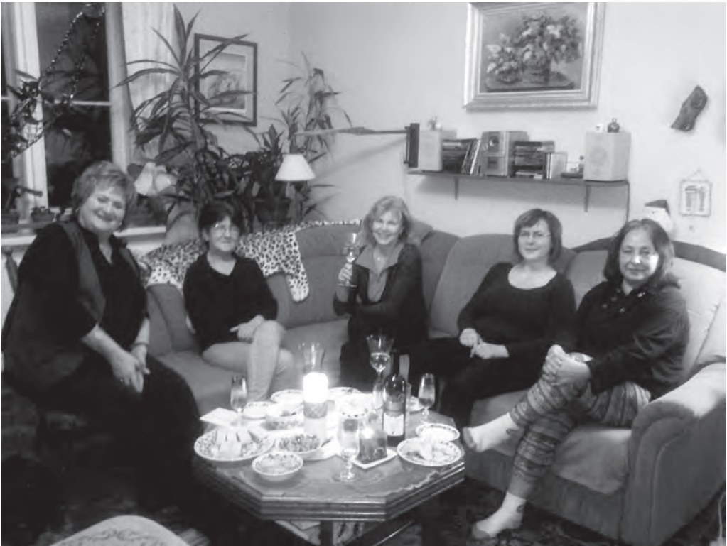
Oslava narozenin, únor 2016.