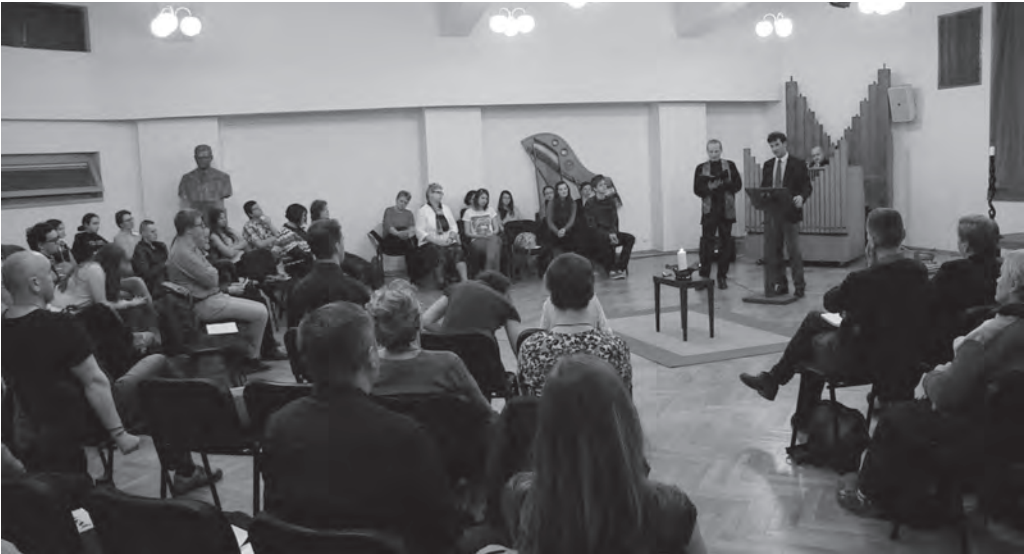
Fotografie z návštěvy transylvánských unitářů v pražské obci.

Berte prosím, milí čtenáři, tento úvod jako nutnou ilustraci té skvělé neděle, kterou jsme v pražské Unitarii prožili s přáteli z Transylvánie. Na samém konci února letošního roku totiž přišel e-mail s prosbou o pomoc. Skupina transylvánských unitářů se chystala navštívit Prahu při své cestě Evropou a chtěli poradit, jak sehnat levné ubytování, které by současně poskytl parkování pro autobus. Kromě toho se také ptali, zda by se jejich skupinka cestovatelů mohla přijít podívat na naše shromáždění, že by nás rádi poznali.